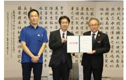
沖縄県庁にて贈呈式

※3:イオングループの主要企業が税引前利益の1%相当額を拠出し、「次代を担う青少年の健全な育成」、「諸外国の友好親善の促進」、「地域社会の持続的発展」を3つの柱となる事業として活動する公益財団法人