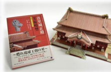
（左から）甦れ！首里城ピンバッジ、一筆箋(16種セット)、甦れ！首里城Tシャツ、美術模型首里城正殿