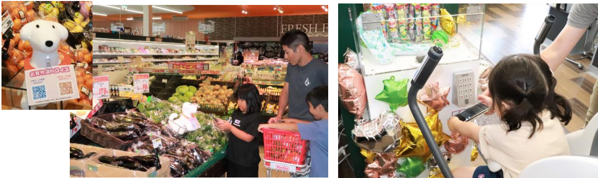
実際に店舗でスマホをかざしQRコードを読み取りお買い物を楽しむ様子

今後も当社は、さまざまなコンテンツの拡充を進めることでリアル店舗の魅力を強化し、お客さま満足度の向上に取り組んでまいります。